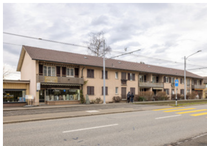
Dübendorfstrasse 157/159