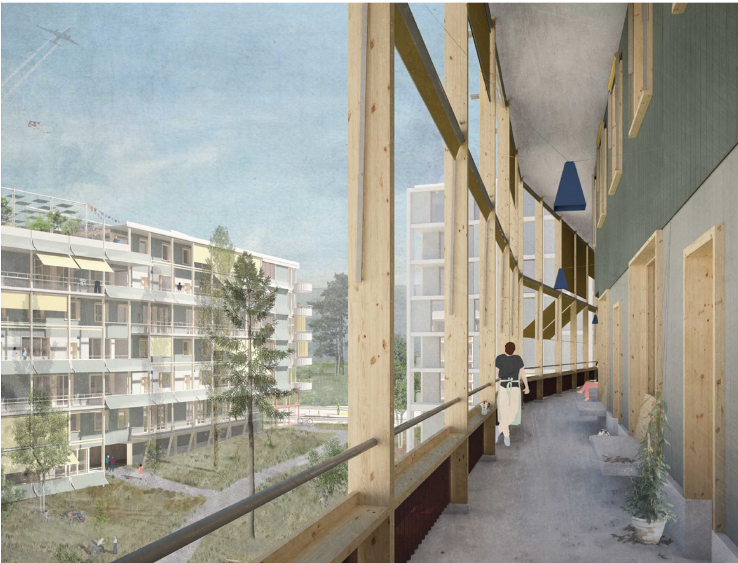
Visualisierung – Blick auf den Laubengang (Bild: Figi Zumsteg Architekten GmbH)

Die Stiftung Einfach Wohnen plant in Zürich Schwamendingen eine neue Wohnsiedlung. Das Amt für Hochbauten hat im Auftrag der Stiftung einen Architekturwettbewerb im selektiven Verfahren mit sieben Teams durchgeführt, der im September 2022 entschieden wurde.