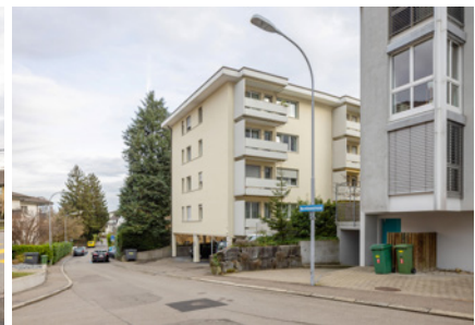
Binzwiesenstrasse 12