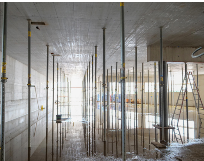
Wohn- und Gewerbesiedlung Guggach, Baustelle (Bild: Donet Schäfer Reimer Architekten)