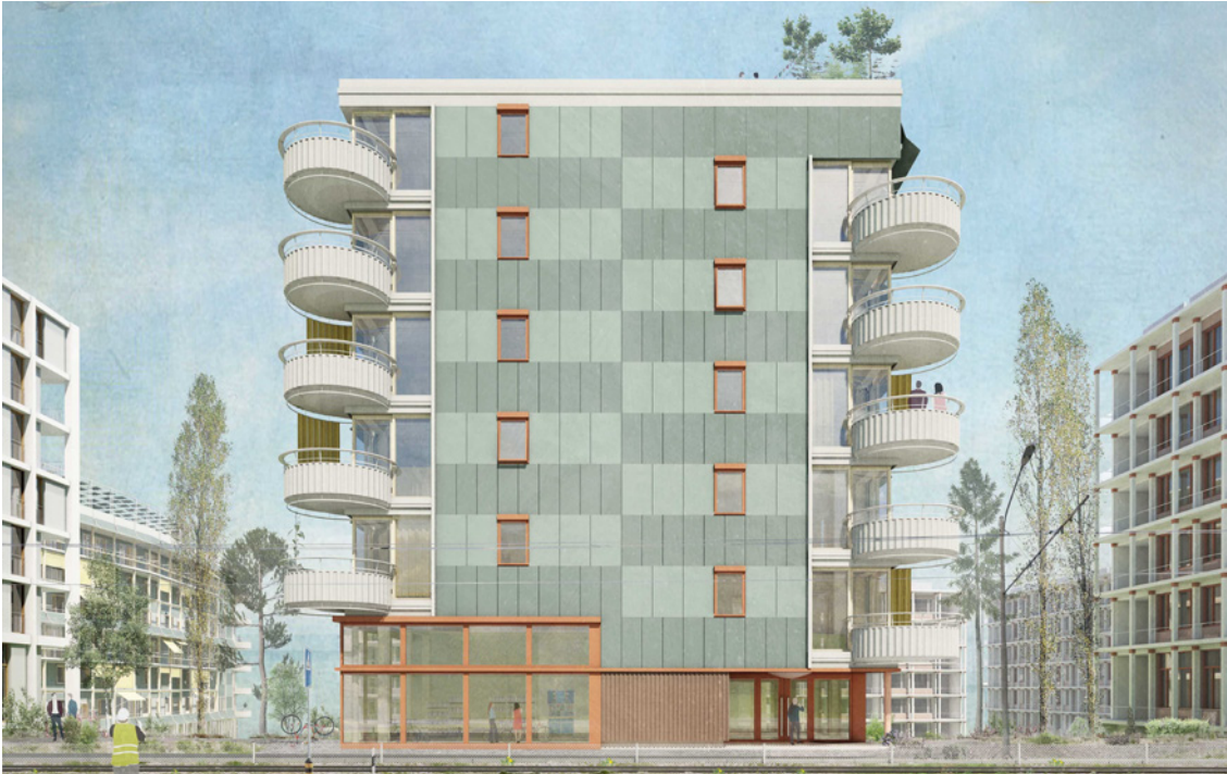
Visualisierung – Blick von der Dübendorfstrasse (Bild: Figi Zumsteg Architekten GmbH)

Die Stiftung Einfach Wohnen plant auf dem Areal Altwiesen-/Dübendorfstrasse in Zürich Schwamendingen zwei Ersatzneubauten für die bestehenden sanierungsbedürftigen Wohnhäuser aus den 1950er-Jahren mit 26 Wohnungen. Ziel des Projekts ist, Wohnraum für eine alters- und herkunftsgemischte Gemeinschaft zu schaffen, die in unterschiedlichen Haushaltformen lebt. Mit der neuen Überbauung kann deutlich mehr Wohnraum geschaffen werden: Es entstehen rund 80 Wohnungen für das untere Drittel der Zürcher Haushaltseinkommen. Zudem sind ein Gewerberaum sowie zwei städtische Doppelkindergärten geplant. Neben dem Aspekt der sozialen Nachhaltigkeit und des gemeinschaftlichen Wohnens ist aber auch der geringe CO 2 -Verbrauch in der Erstellung sowie im Betrieb zentral. Um einen ökonomischen Flächenverbrauch zu gewährleisten, wurde im Wettbewerb deshalb ein Hauptnutzflächenanteil von maximal 30 m 2 pro