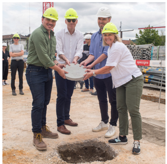
Wohn- und Gewerbesiedlung Guggach, Grundsteinlegung