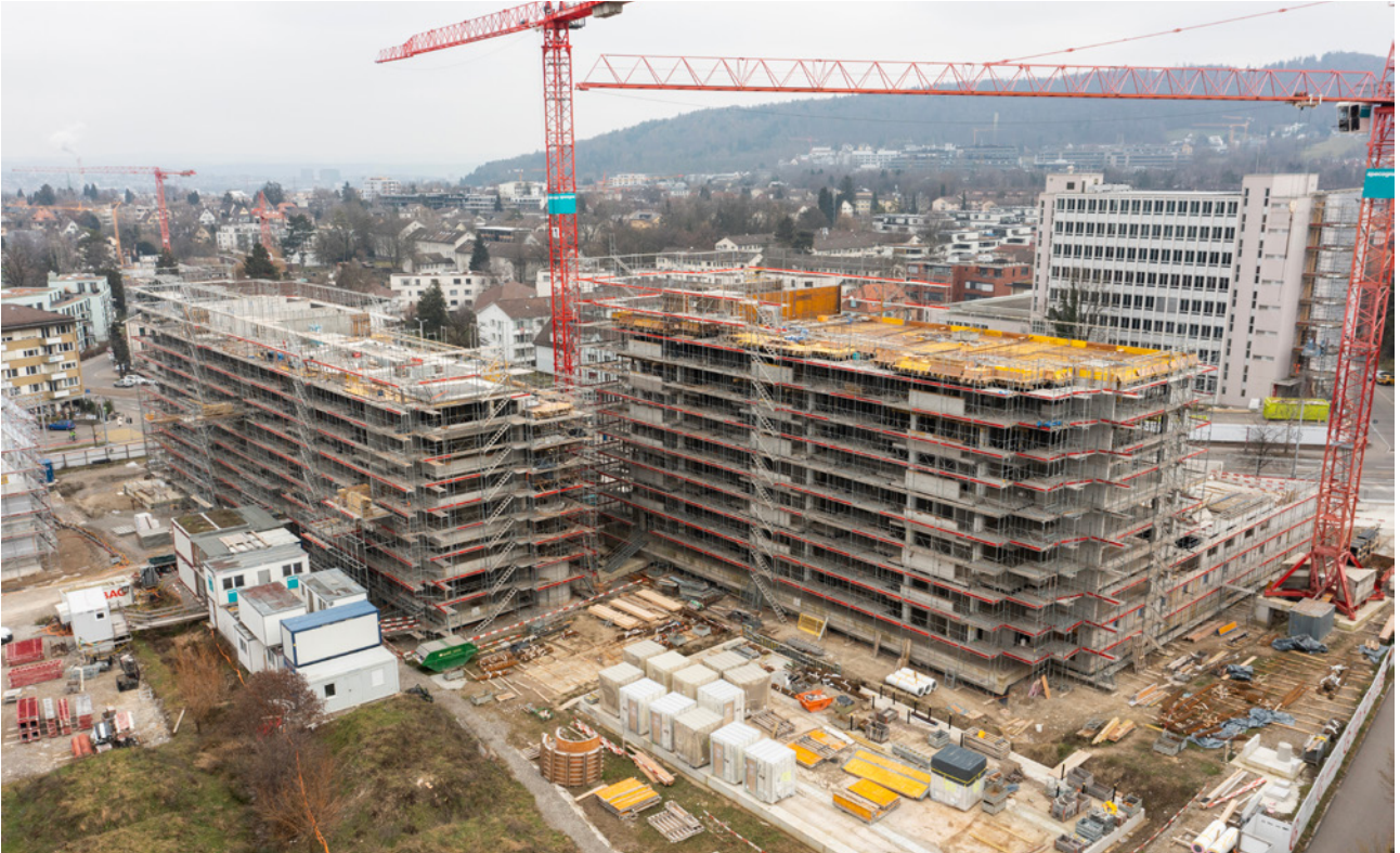
Wohn- und Gewerbesiedlung Guggach, Luftbild der Baustelle