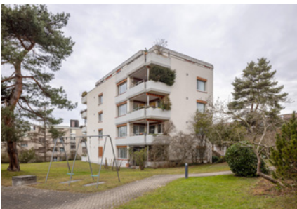
Wiesliacher 45