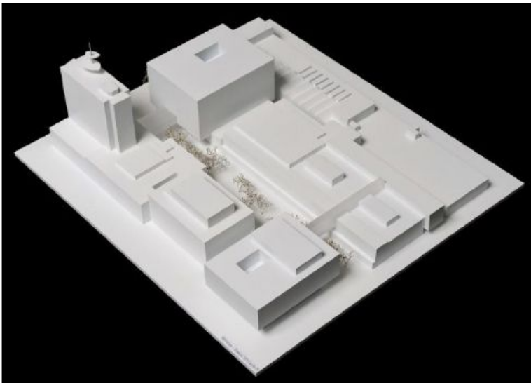
Modell Projekt «Mélange» aus Studienauftrag; Endausbau; Sicht auf das Modell von Süden.

In den Jahren 2012 und 2013 führte SRG/SRF privat unter Mitwirkung des Amtes für Städtebau einen zweistufigen Studienauftrag mit fünf Planungsteams durch. Das Ziel der Studie war, mit den eingereichten Vorschlägen eine qualitativ hochwertige städtebauliche Gesamtsicht bzw. Vision für den Standort Leutschenbach zu entwickeln. Im Rahmen dieser Vision werden die kurz-, mittel- und langfristigen Projekte gemäss den betrieblichen und programmlichen Bedürfnissen in Etappen umgesetzt. Das von der Jury ausgewählte Projekt «Mélange» der Penzel Valier AG, Zürich, stärkt die bestehende Gebäudestruktur und ergänzt die Baukuben überzeugend. Das Projekt bzw. der Masterplan sieht vor, dass sich SRF durch eine modulare Etappierung flexibel den verändernden Verhältnissen anpassen kann, und belegt, dass die räumlichen Anforderungen von SRF mittels der Konzentration auf das Stammareal Leutschenbach erfüllt werden kann.