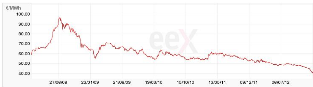
Abbildung 1: Entwicklung Grosshandelsstrompreis an der EEX im deutschen Markt (Baseload).

Seit 2008 sanken die Strompreise von rund 10 Euro Cents/kWh (100 Euro/MWh) auf rund 4 Euro Cents/kWh (40 Euro/MWh).