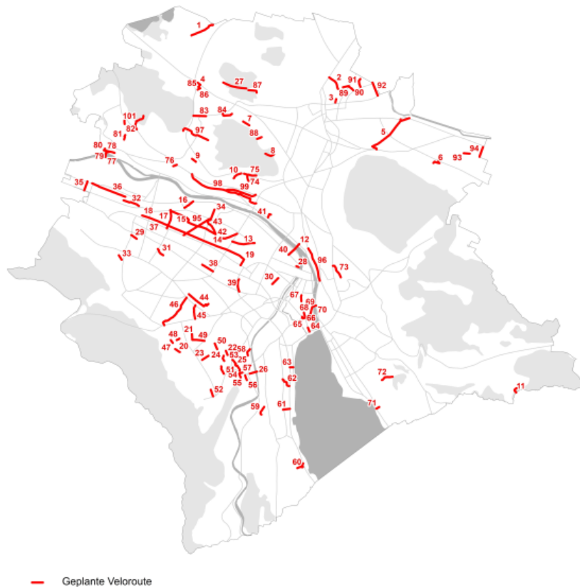
Abbildung 9.43 Geplante Velorouten