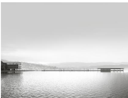
Abb. 2: Visualisierung Siegerprojekt EMERGENCE, WALDRAP AG Zürich, öffentliche Mole (©ZUEND, Zürich)

Auf der Grundlage dieser Machbarkeitsstudie erfolgten in den Jahren 2017/18 die Machbarkeitsstudie für die Verschiebung der WAPO unter allfälligem Einbezug einer privaten Werft und der Wettbewerb «Marina Tiefenbrunnen». Das Ergebnis der Planungen ist im Richtprojekt zusammengeführt, das die Grundlage für den öffentlichen Gestaltungsplan «Marina Tiefenbrunnen» bildet und dem Gestaltungsplan beigelegt ist.