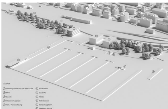
Abb. 4: Richtprojekt, Volumenmodell, Endausbau

Die Etappe «Wasserschutzpolizei, Werft und Park» kann ab 2030 bzw. nach Ablauf des bestehenden Baurechtsvertrags mit der privaten Werft realisiert werden. Sie umfasst die Realisierung des Ersatzneubaus der WAPO mit privater Werft und die Umsetzung des öffentlichen Parks auf dem heutigen Areal der WAPO.