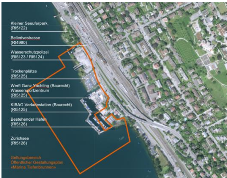
Abb. 1: Übersicht mit Gestaltungsplanperimeter (rot) und der heutigen Nutzungen im Gebiet der «Marina Tiefenbrunnen»

Das Seegrundstück liegt in der Hoheit des Kantons Zürich.