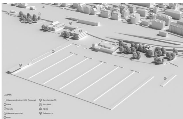
Abb. 3: Richtprojekt, Volumenmodell, Etappe Wassersportzentrum und Hafen

Die Hafenanlage wird als Schwimm-Mole konzipiert und beinhaltet neben rund 420 permanenten und maximal 30 temporären Boots Liegeplätzen eine rund 17 m breite, öffentlich zugängliche Mole, auf der eine Buvette mit Gastronomieangebot realisiert werden kann. Die permanenten Wasserliegeplätze werden andernorts im Zürcher Seebecken aufgehoben und im neuen Hafen konzentriert. Umgelagert bzw. ersetzt werden vor allem bestehende Bojenplätze. Die im heutigen Hafen Tiefenbrunnen bestehenden 99 Wasserliegeplätze werden im neuen Hafen der «Marina Tiefenbrunnen» aufgenommen. Der bestehende, nördliche Trockenplatz wird aufgrund der zusätzlichen Bauten und Anlagen auf dem Areal in seiner Grösse reduziert. Der bestehende, südliche Trockenplatz wird nicht verändert und bleibt bestehen. Die Boote können auf beiden Trockenplätzen kompakter angeordnet werden, sodass die für die Boote zur Verfügung stehende Fläche möglichst gut ausgenutzt werden kann.