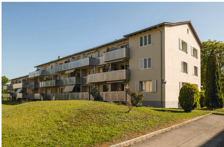
Riedenhaldenstrasse 72 / 74 / 76