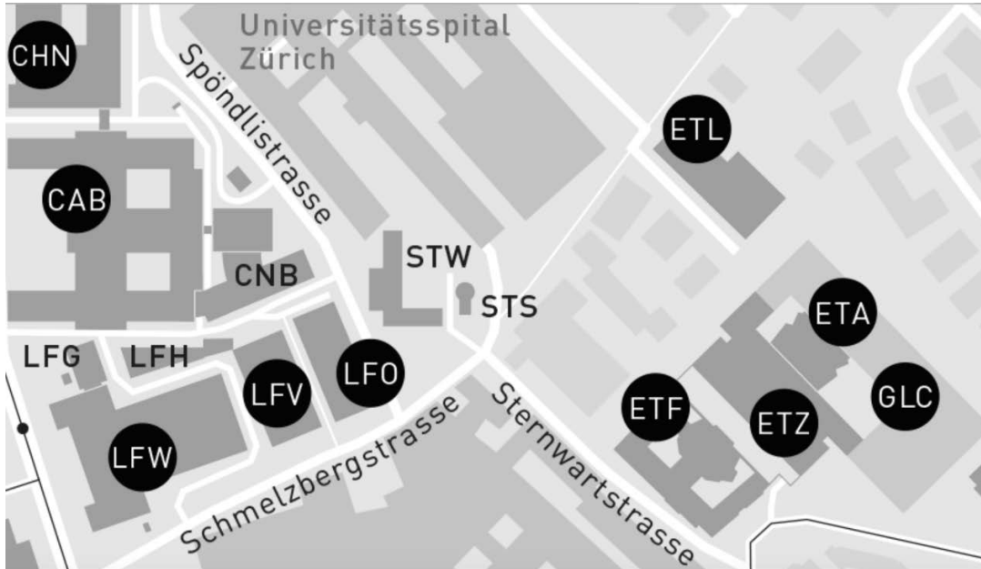
Karte mit den ETH Gebäudekürzeln zur Orientierung

Gebäude Standorte der ETH: https://www.ethz.ch/services/de/service/raeume-standorte-transporte/raeume-gebaeude/orientierung/zentrum.html