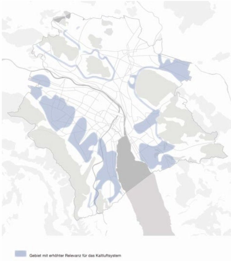
Abbildung 16: Konzeptkarte Erhaltung Kaltluftsystem

Die Abbildung zeigt schematisch die Gebiete mit erhöhter Relevanz für die Abstimmung von baulicher Entwicklung und Erhaltung des Kaltluftsystems in nachfolgenden Planungen.