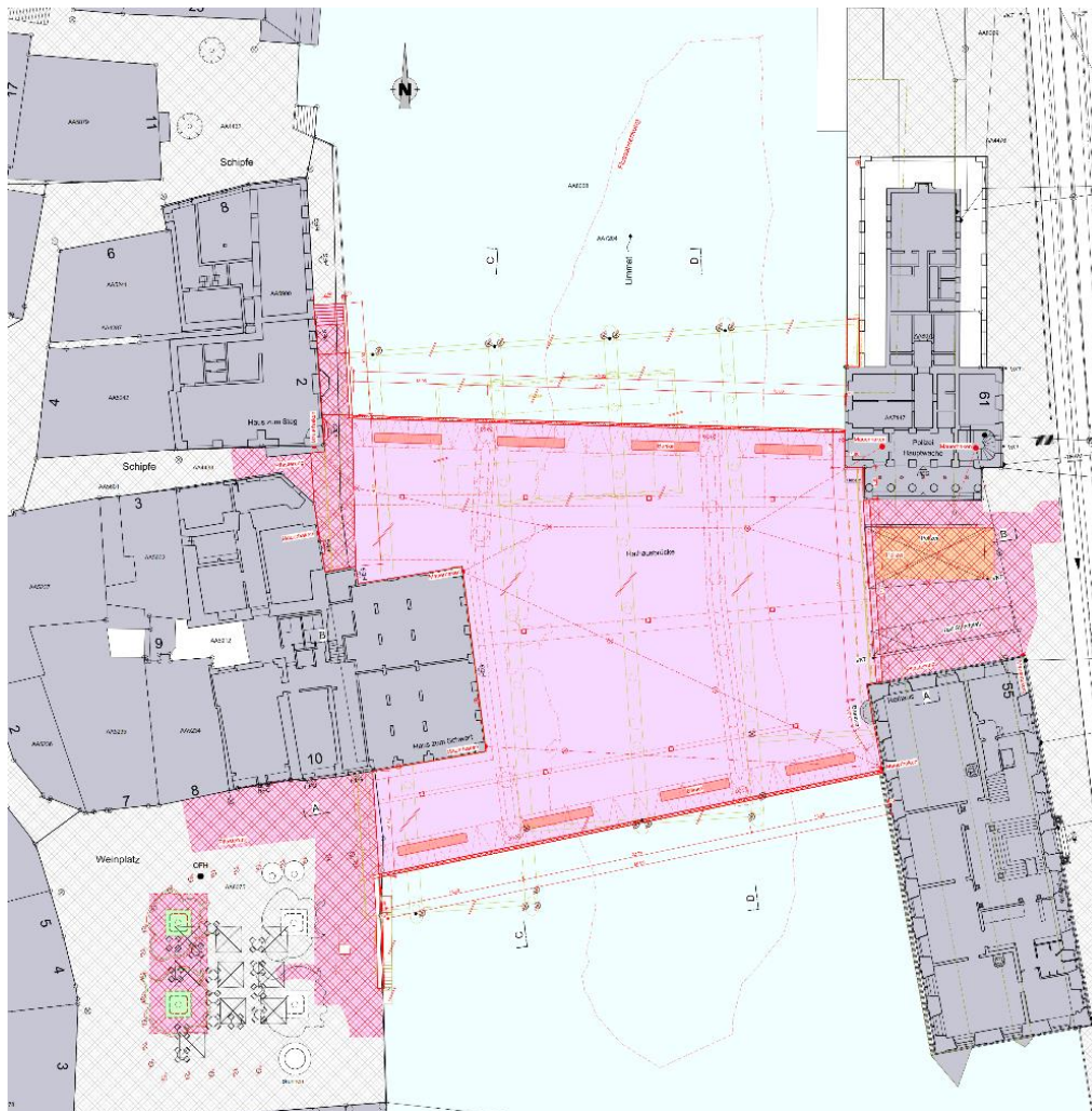
Abbildung 1 Situation: Rote Linien: Situation der neuen Rathausbrücke. Westliches Ufer Weinplatz, Haus zum Schwert und Schipfe, östliches Ufer Rathauswache mit Rathaus-Café, Limmatquai und Rathaus. Rot gestrichelte Linie: Flusssohlenabsenkung in der Limmat als Hochwasserschutzmassnahme. Gelbe Linie: Situation alte Rathausbrücke.