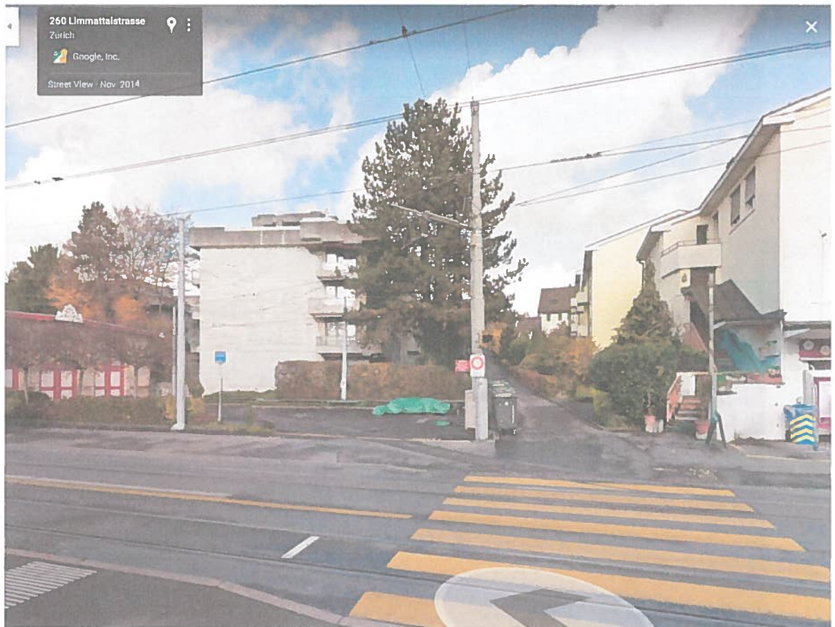
Ansicht der Situation bei der Tramremise