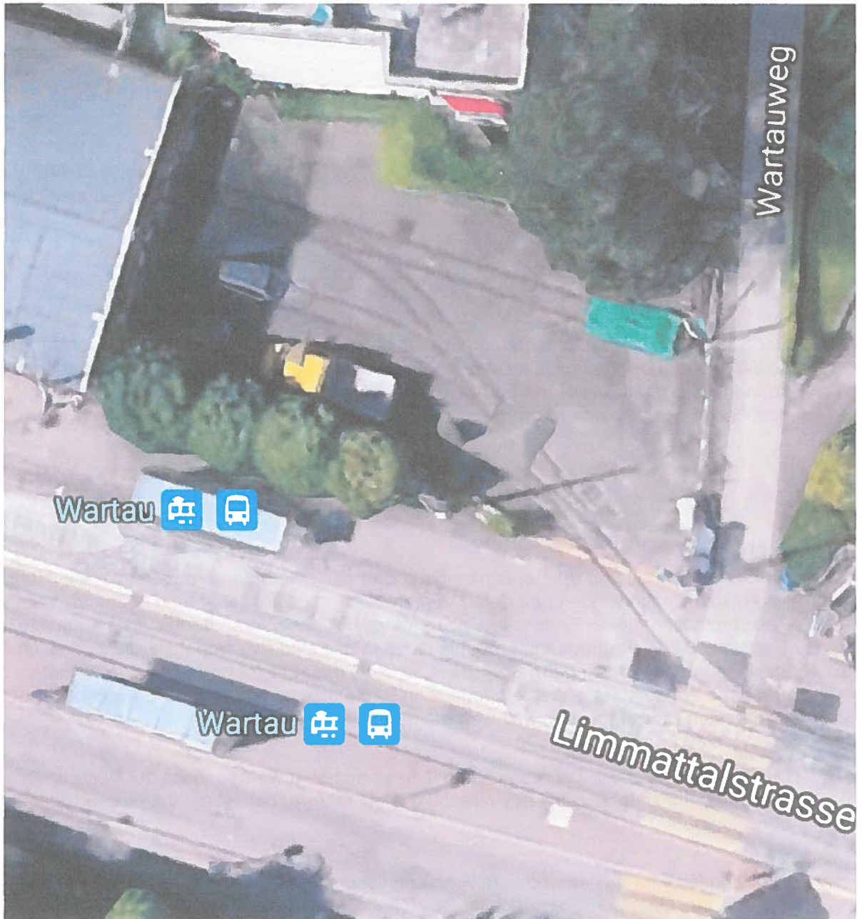
Situation Tramremise. Hier kann man mit gutem Willen sieben oder mehr Parkplätze schaffen.