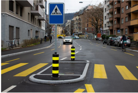
Manessestrasse: Mit der Sanierung der Manessestrasse, im Abschnitt Zurlindenstrasse bis Manesseplatz, wurde Platz geschaffen für Velostreifen auf beiden Strassenseiten.