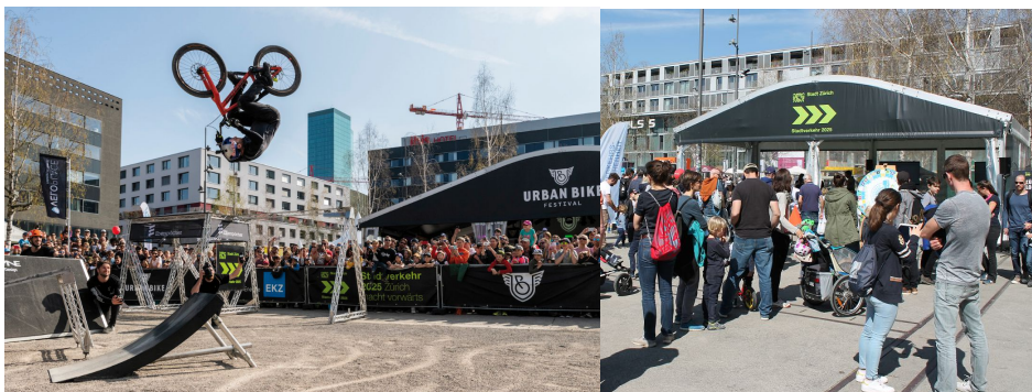
Stimmungsbild vom Urban Bike Festival Zürich 2019 und Stand Stadt Zürich

Als weitere Massnahme im Rahmen der Verkehrssicherheit ist die 2019 gestartete Kampagne «Grosi an Bord» der DAV zu erwähnen. Mit der Präventionskampagne soll in der Stadt Zürich die gegenseitige Rücksichtnahme im Strassenverkehr gefördert und somit die Verkehrssicherheit, nicht zuletzt die der Velofahrerinnen und Velofahrer, erhöht werden.