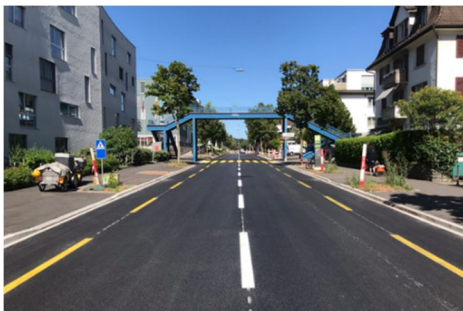
Regensbergstrasse: Nach Abschluss der Sanierungsarbeiten an der Regensbergstrasse wurde auf beiden Seiten ein rund 600 m langer Velostreifen markiert.

Neben diesen – in Beilage 1 und 2 aufgeführten – Strassenbauprojekten wurden diverse weitere Massnahmen zur Verbesserung des Veloverkehrs umgesetzt. Dazu gehören folgende Projekte: