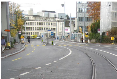
Gloriastrasse: An der Gloriastrasse bewegt sich der motorisierte Individualverkehr neu talwärts auf der gleichen Spur wie das Tram. Mit dieser Massnahme wurde genügend Platz geschaffen, um bergwärts einen Velostreifen zu markieren.